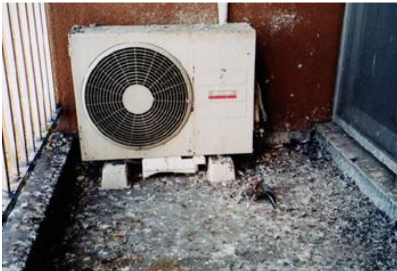
鳩対策を行う前のベランダ

この言葉は非常にうれしいです。 会社としてではなく、人間どおしのお付き合いが できる関係を目指しているからです。